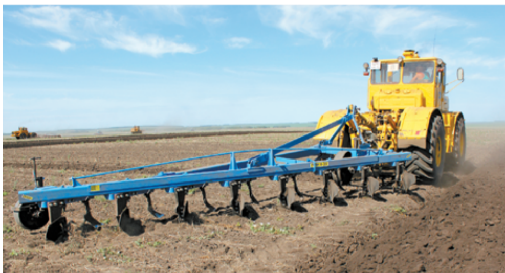
фото Сергея ВЧЕРАШНЕГО

Пресс-центр Минсельхоза Челябинской области